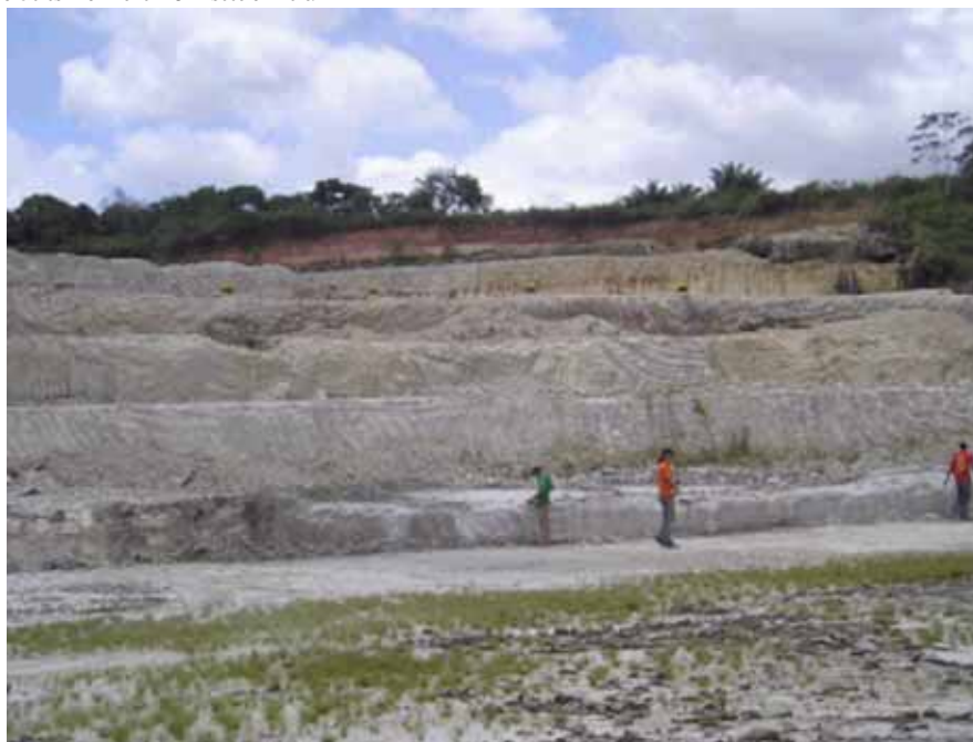
Figura 3 - Mina B-17: parte de sua seção colunar, onde se observam bancadas abertas para a exploração do calcário. Trata-se de biocalcarenitos não estratificados, arenitos finos e calcários. Figure 3 - Mine B-17: part of the geologic section on the mine walls opened to limestone exploration, exposing massive fossiliferous carbonatic sandstones fine-grain sandstones and limestones.