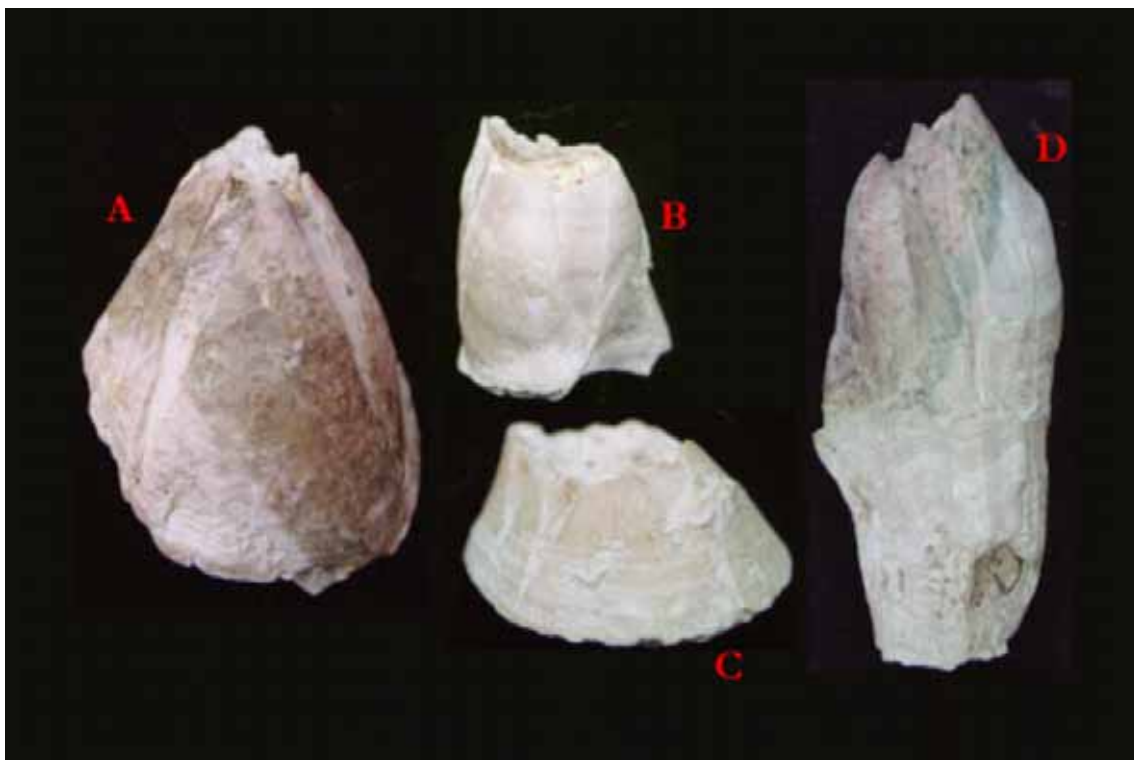
Figura 5 – Bioma balanóide da ecofácies Capanema da Formação Pirabas, preservados tridimensionalmente e em posição de vida, com vestígios do biócromo. (a) Balanus dentivarians ; (b) B. eburneus ; (c) B. improvisus ; (d) Megabalanus tintinnabulum .

marinha encontrada na costa brasileira atual. Foram confirmadas as espécies Balanus eburneus Gould e B. improvisus Darwin, assinaladas por Brito (1977). Também a espécie M. tintinnabulum (Linnaeus) foi corroborada, só que caracterizada no gênero Megabalanus , anteriormente considerada como pertencente ao gênero Balanus . Além disso, foi reconhecida pela primeira vez na Formação Pirabas e como fóssil no Brasil, Balanus dentivarians Henry, que ocorre atualmente no oeste da América Central e México, até o Equador na América do Sul (Henry & McLaughlin, 1975).