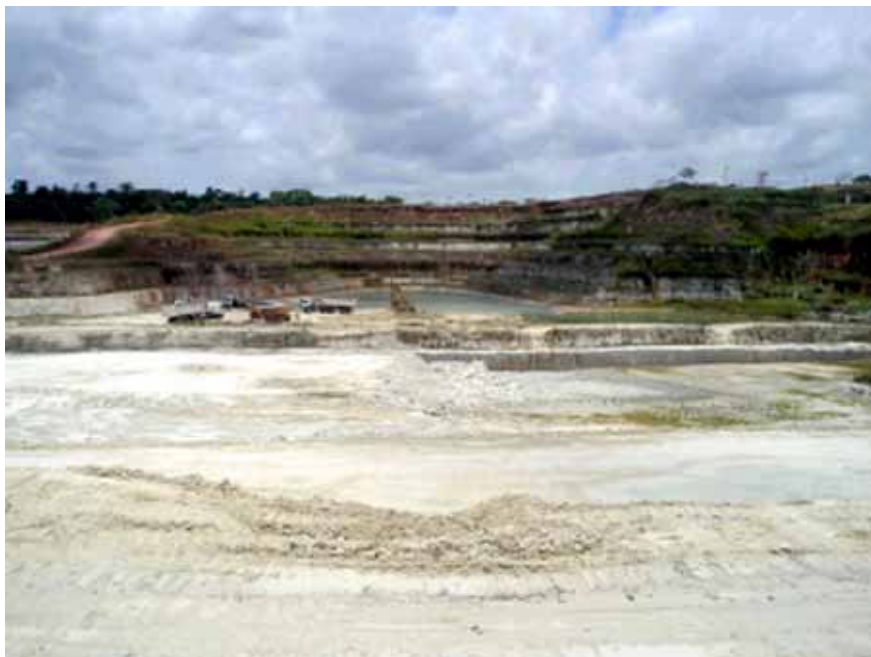
Figura 2 - Vista geral da Mina B-17, mostrando parte da seção carbonática e arenitos no topo, ao fundo, enquanto os níveis abaixo cinza claros, correspondem a algumas das litofácies carbonáticas, do total de cerca de 20m da seção completa. Figure 2 - General view of Mine B-17, showing part of the carbonatic section and sandstones (top, on the back). The pale gray levels correspond to different carbonatic lithofacies from the 20m section left.

brasileiras de matéria prima para fabricação de cimento. Com cerca de 20 metros de espessura, o topo da seção, cerca de aproximadamente 3 metros, correspondem à Formação Barreiras, cuja composição química e mineralógica não favorece seu aproveitamento industrial, fazem deste pacote superior apenas rejeito, que é retirado para que os níveis de calcários imediatamente subjacentes, possam ser beneficiados.